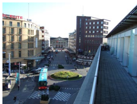
Ausblick auf die Bahnhofstrasse

In diesem Sinne wünschen wir Ihnen einen schönen Herbst und viel Weitsicht in der Planung 2007